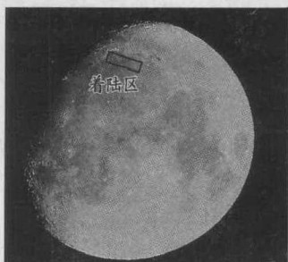
图1 “嫦娥三号”着陆时的月相

“嫦娥三号”于12月6日进入高度为100千米的环月圆轨道。对于已近在咫尺的月球,“嫦娥三号”为何还要绕飞8天后才着陆呢?据专家介绍,这主要是由落月时间、落月区域和月球的环境特点所决定的。由于月球的昼夜温差大,为使“嫦娥三号”能在月球中午高温到来前完成月球车与着陆器的分离,其必须在月球的上午着陆,这一时间上的限制决定了“嫦娥三号”要多飞几天。“嫦娥三号”平稳落月时正逢渐盈凸月,亮面朝西。该渐盈凸月在太阳落山时会出现在地球上东偏南约45度左右的天空,至21时已近南方天空,故在地球上容易直接观察,并能保持通讯顺利,以便测控。而此时月球的虹湾地区恰好是凌晨时分(如图1所示),不仅有较小的太阳高度角利于成像,更便于“嫦娥三号”着陆后相关后续工作的开展。